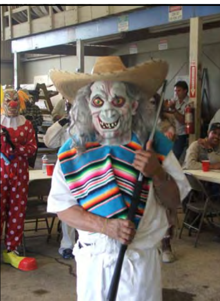
Antonio Cruz or "El Viejo" Revolucionario