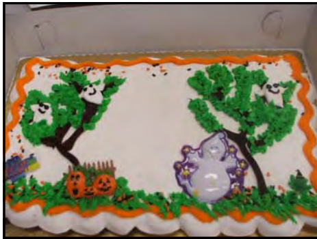
A very scary cake