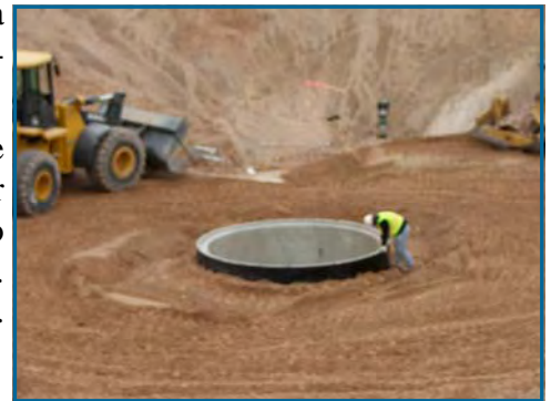
Redcliff workers prepare concrete manhole for further safe in ground installation