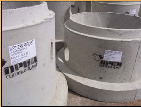
Manholes used for Hueco Club Apartment Project sewer lines.

Accent Landscaping has been providing El Paso with a variety of services for over 25 years. Since 1982, Accent Landscaping has provided El Paso with services ranging from street scaping, to golf course irrigation, and utility projects. Accent has even opened up shop in Albuquerque, NM and extends their service reach to Colorado and New Mexico.