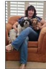
Paulette Quintana Daschund - Hazelnut (11-year-old) Shitzu/Malteze mix -Charlie (4 years old)